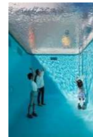
Leandro Erlich The Swimming Pool , 2004