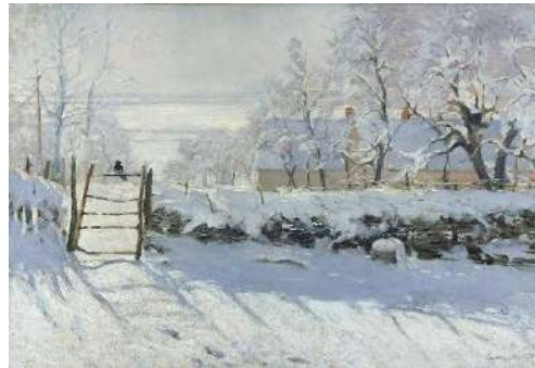
Claude Monet, La pie , 1868