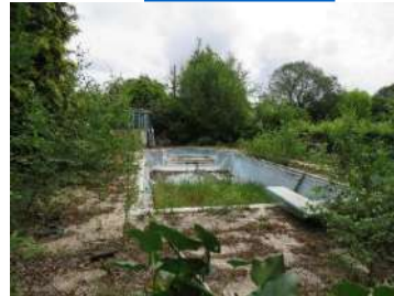
Piscine (seine maritime)