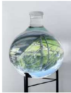
Patrick Bailly Maître Grand "Boule d'eau » 2013