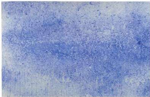
Yves Klein, Cosmogonie pluie , 1961

Photographier les effets de l'eau (reflets, éclaboussures, gouttes d'eau sur des vitres...)