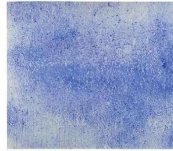
Yves Klein , Cosmogonie pluie , 1961