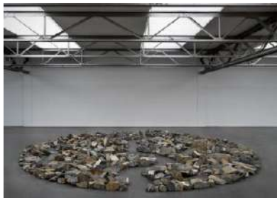
Richard Long Quiet Skies Circle , 2022.