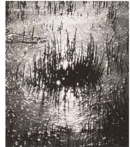
Lucien Clergue Camargue , 1965