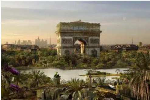
Chris Morin-Eitner, Paris, Arc VII , 2021

Collectionner les images de paysages avec ou sans eau, imaginer leur transformation si il n'y avait plus d'eau ou si au contraire l'eau recouvrait tout. Les mettre en image (dessin, photomontage)