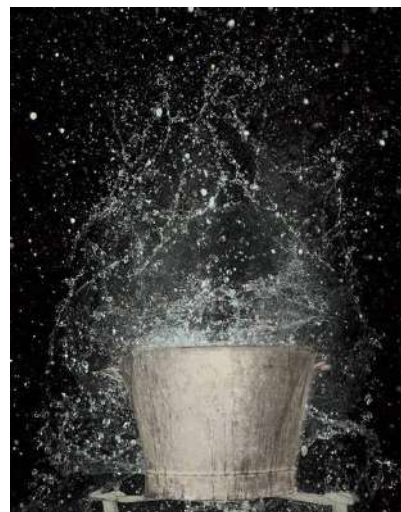
Patrick Bailly-Maître-Grand, Poussières d'eau , 1994

Expérimenter sur les projections d'eau: laisser tomber un objet dans un récipient d'eau. Prendre en photo le moment opportun afin de garder une trace des éclaboussures obtenues. Faire varier les tailles/masses des objets et comparer les projections.