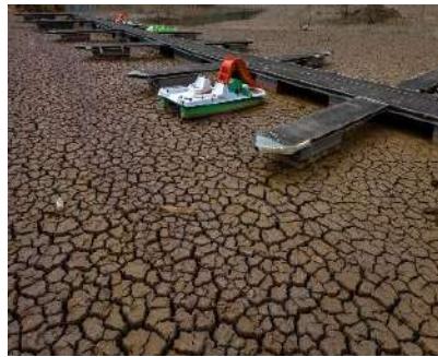
Emilio Morenatti L' Espagne face à la sécheresse 08/2023