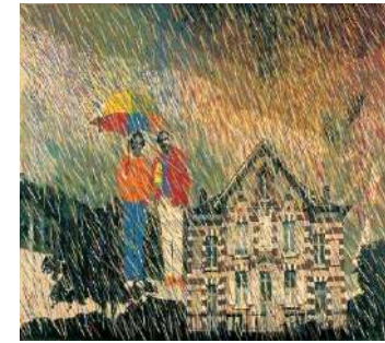
Gérard Fromanger , En weekend à Dammarie en Puisaye , 1984