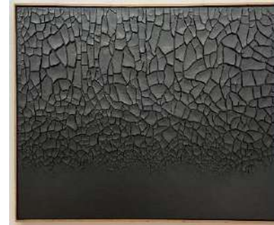
Andy Goldsworthy "River of Earth" , 1999.