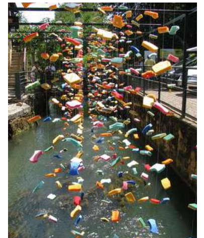
Jean-Luc Bichaud, Apporter de l'eau au moulin, 2009

Lister tous les objets qu'on utilise en lien avec la présence de l'eau dans nos maisons, les collectionner, en faire des accumulations