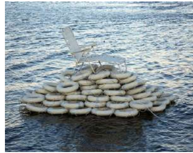
Jenny Kendler , Lounging Through the Flood , 2019